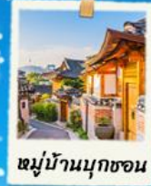
หมู่บ้านนุยกซอน