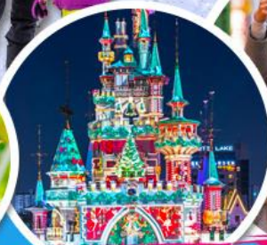
สวนสนุกก็อตเต้