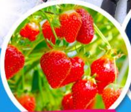
ไรสตอร์จ์เบอร์รี่

• สายจุ่มห้ามพลาด!! ไอเทมดัง POP MART ตลาดดัง เมียงดง + ฮงแด