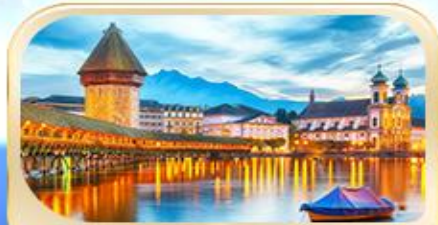
สะพานไมซ์าเปค