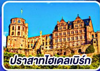
ปราสาทไฮเดลเบิร์ก