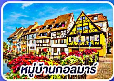
หมู่บ้านกอลมาร์