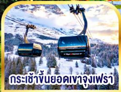
กระเช้าขึ้นยอดเขาจุงเฟรา

ฝรั่งเศส - เบลเยียม - เนเธอร์แลนด์ เยอรมนี - สวิตเซอร์แลนด์ 10 วัน 7 คืน