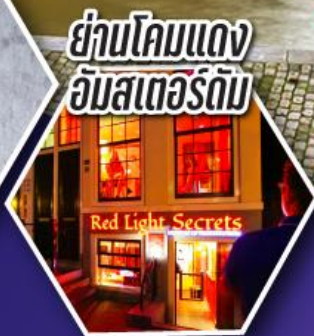
ย่านโคมแดง อัมสเตอร์ดัม

ตะลุยอัมสเตอร์ดัม ทั้งคูร์สดามสแควร์ และย่านโคมแดง (Red Light)