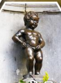
แมนเกินฟิส