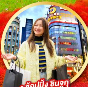
• ช้อปปิ้ง ชินจูกุ

พักโรงแรมในโตเกียว 2 คืน พักออนเซ็น 2 คืน