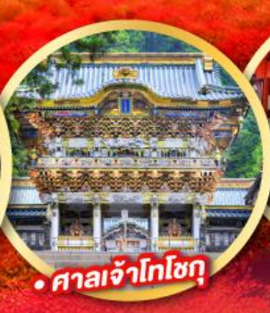
• ศาลเจ้าโทโชกุ