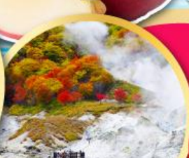
หุบเขานรกจโทกุตามิ

ชมเทศกาลประดับไฟ ใจซังเคเนเจอร์ลูมินาเรียะ