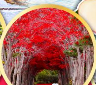
อุโมงค์ไม้แป้นแดง ณ สวนลับฮิราโอกะ