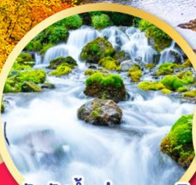
สัมผัสน้ำแร่ธรรมชาติ ณ สวนฟุทดาชิ