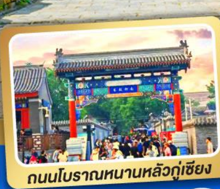
ถนนโบราณหนานหลิวคู่เซียง