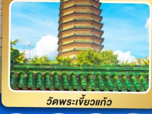
วัดพระเจี๊ยะท้าว

เมนูพิเศษ เปิดปักกิ่ง, ชาหมูหม้อไฟ อาหารกวางตุ้ง, อาหารเสฉวน