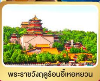
พระราชวังฤดูร้อนอี้เหอหยวน