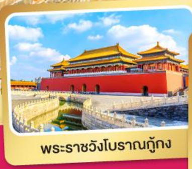
พระราชวังโบราณกู้กง