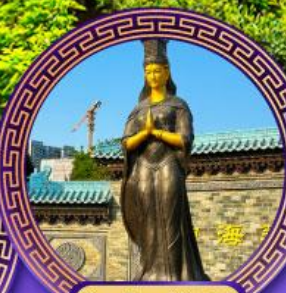
วัดเจ้าแม่กิม