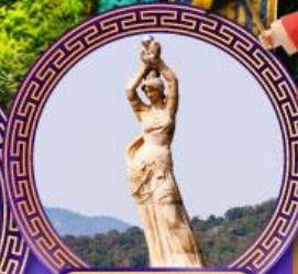
จูไห่พิพิธภัณฑ์