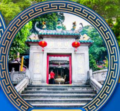
วัดอาม่า มาเก๊า