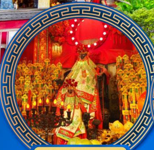
วัดเจ้าแม่กวนอิมสองห้า