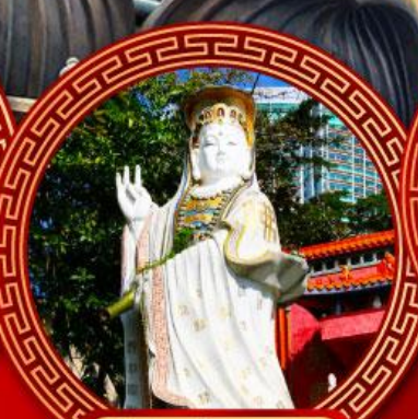
เจ้าแม่กวนอิม ริพัลส์เบย์