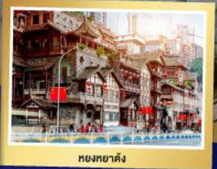
หยงหยาดัง