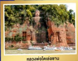
หลวงพ่อดิล่อซาน