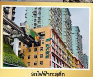
รถไฟฟ้าคุ่อฉู่