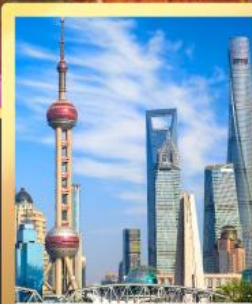
เซี่ยงไฮ้