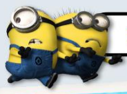
ZONE 5 : THE LOST WORLD