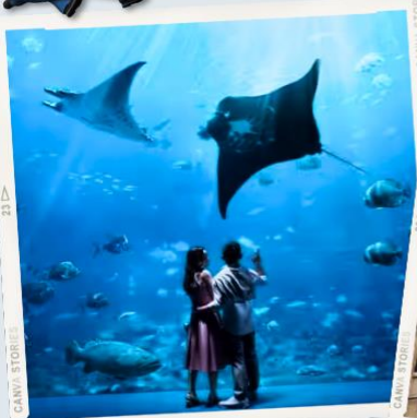
ZONE 7 : FAR FAR AWAY