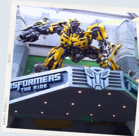
ZONE 1 : HOLLYWOOD