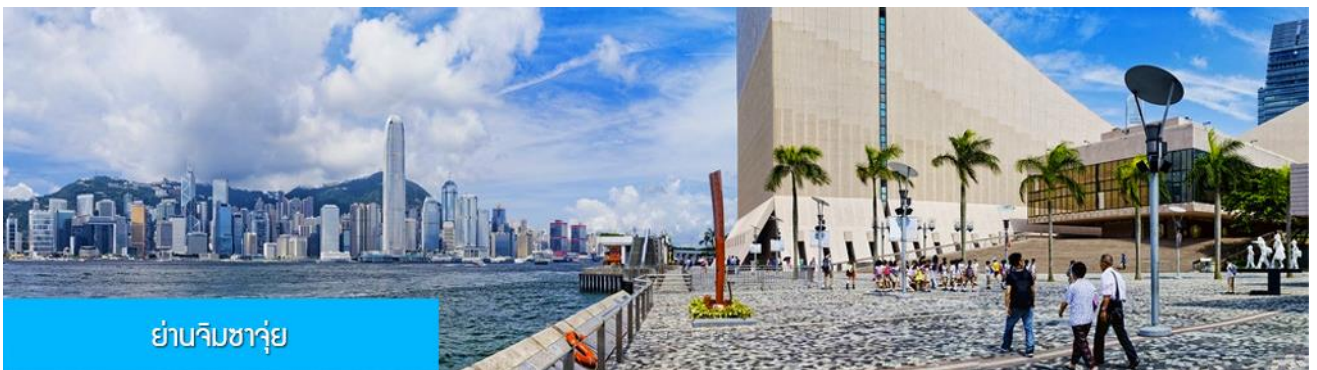
ย่านจิมซาจุ่ย