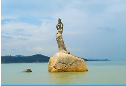
จูไห่พีชเซอร์กิส