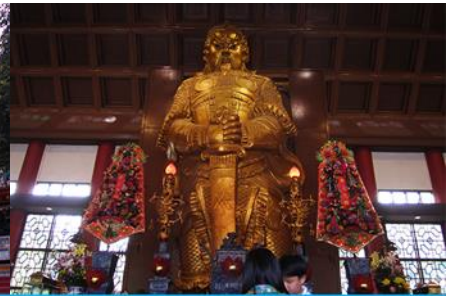
วัดเขกวงเมียว