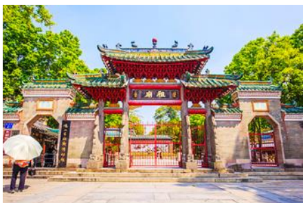
วัดจูเมี่ยว

นำท่านเที่ยวชม ตลาดใต้ดินก่งเปย 拱北地下市场 เป็นตลาดใต้ดินขนาดใหญ่ที่ตั้งอยู่ใต้อาคารด่านตรวจคน