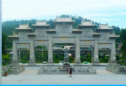
วัดผู้โกวซื่อ