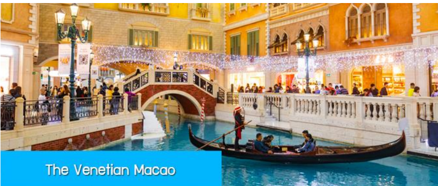
The Venetian Macao

จากนั้นนำท่านผ่านด่านกักเปี้ยเพื่อเดินทางสู่ เมืองมาเก๊า 澳門 เขตปกครองพิเศษที่อยู่ใต้สุดของจีน ที่ได้ชื่อว่าเป็น ลาสเวกัสของเอเชีย แหล่งรวมสถานบันเทิง คาสิโน โรงแรม รีสอร์ท และร้านจำหน่ายสินค้าแบรนด์เนมชั้นนำจากทั่วโลก อีกทั้งยังเป็นเมืองท่องเที่ยวยอดนิยมที่นักท่องเที่ยวทั่วโลกเดินทางมาเยือนปีละ 30 ล้านคน.. ข้ามสู่เมืองมาเก๊า