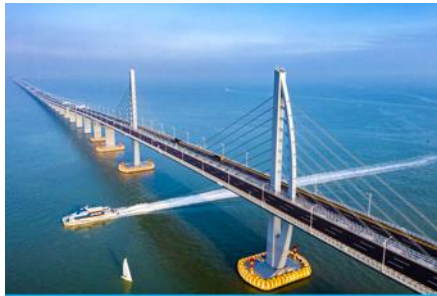
สะพาน อ่าวกง จูไห่ มาเก๊า

พักที่ IRVINE HOLIDAY HTL OR HUICHANG HTL 3* หรือโรงแรมในระดับเดียวกันในเมืองจูไห่