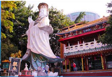
อ่าว Repulse Bay