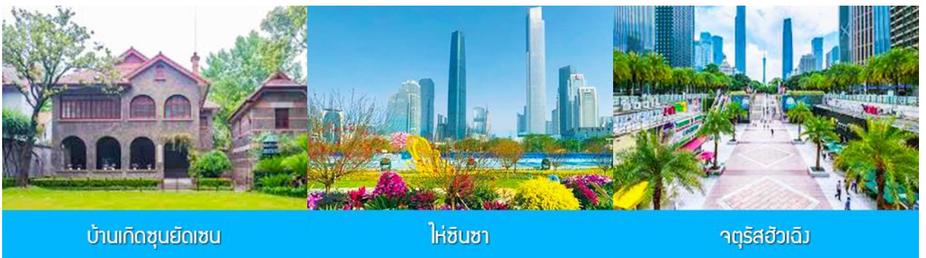
บ้านเกิดชุมชนยัดเซน

พักที่ IRVINE HOLIDAY HTL OR HUICHANG HTL 3* หรือ โรงแรมในระดับเดียวกันในเมืองจูไห่