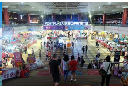
ตลาดใต้ดินก่งเปย

เข้าเมืองก่งเปยของเมืองจูไห่ เป็นแหล่งรวมร้านค้า ร้านอาหาร ซูเปอร์มาร์เก็ตขนาดใหญ่ จำนวนหลายร้อยร้าน ให้ท่านเพลิดเพลินกับการเดินเที่ยว ชมและเลือกซื้อสินค้าพื้นเมือง ชิมอาหารพื้นเมืองตามอัธยาศัย