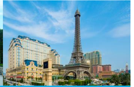
The Parisian Macao