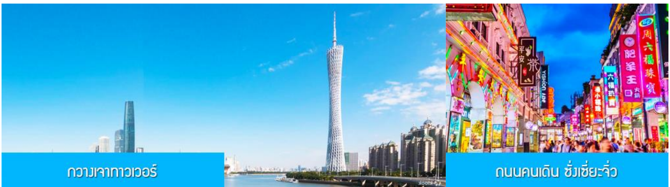
กวางเจาทาวเวอร์