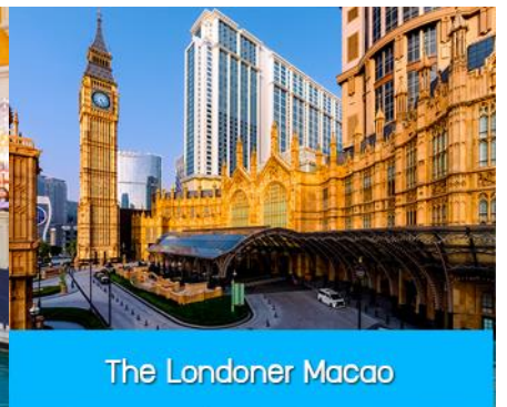
The Londoner Macao