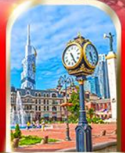
BATUMI CITY ADJARA

เมืองกัอูพลิสซิค ■ ป้อมอบาบูรี ■ นั่งกระเช้าชมเมืองบอร์โจมี อนุสาวรีย์มิตรภาพ รัสเซีย-จอร์เจีย ■ โบสถ์เกอร์เกดี วิหารจวารี ■ มหาวิทยาลัยสเวทิสสาคเวลี