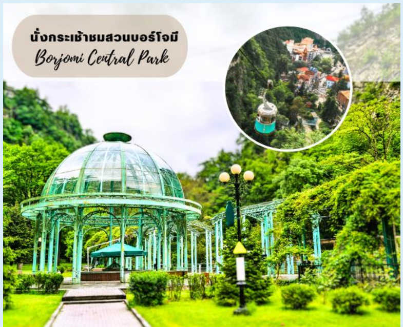
นั่งกระเช้าชมสวนบอร์โจมี Borjomi Central Park

ชม สวนบอร์โจมี (Borjomi City Park) สถานที่ท่องเที่ยวและพักผ่อนของชาวเมืองบอร์โจมีที่นิยมมาเดินเล่น และผ่อนคลาย โดยการแช่น้ำแร่ในวันหยุด จากนั้นนำท่านนั่งกระเช้าสู่จุดชมวิวบนหน้าผาเหนือสวนบอร์โจมี