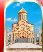
HOLY TRINITY CATHEDRAL