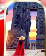
THE CHRONICLE OF GEORGIA