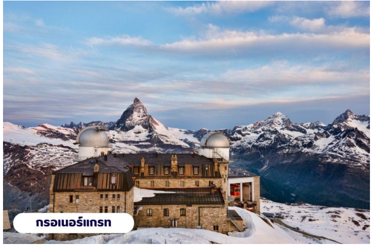
กรอเนอร์แกรท

ถึงเวลาอันสมรนำท่านเดินทางกลับสู่เมืองเซอร์แมทอีกครั้งโดยรถไฟ อิสระท่านเดินเล่นชมเมืองเซอร์แมท เลือกซื้อสินค้าของฝากพื้นเมือง หรือนาฬิกาสวิสอันขึ้นชื่อตามอัธยาศัย สมควรแก่เวลานำท่านขึ้นรถไฟกลับสู่เมืองแทสซ์