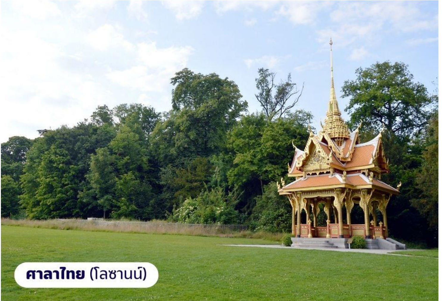
ศาลาไทย (โละซานน์)

วันที่ห้า แتشซ์-เซอร์แมท-ยอดเขากอร์เนอร์กรัท-แتشซ์