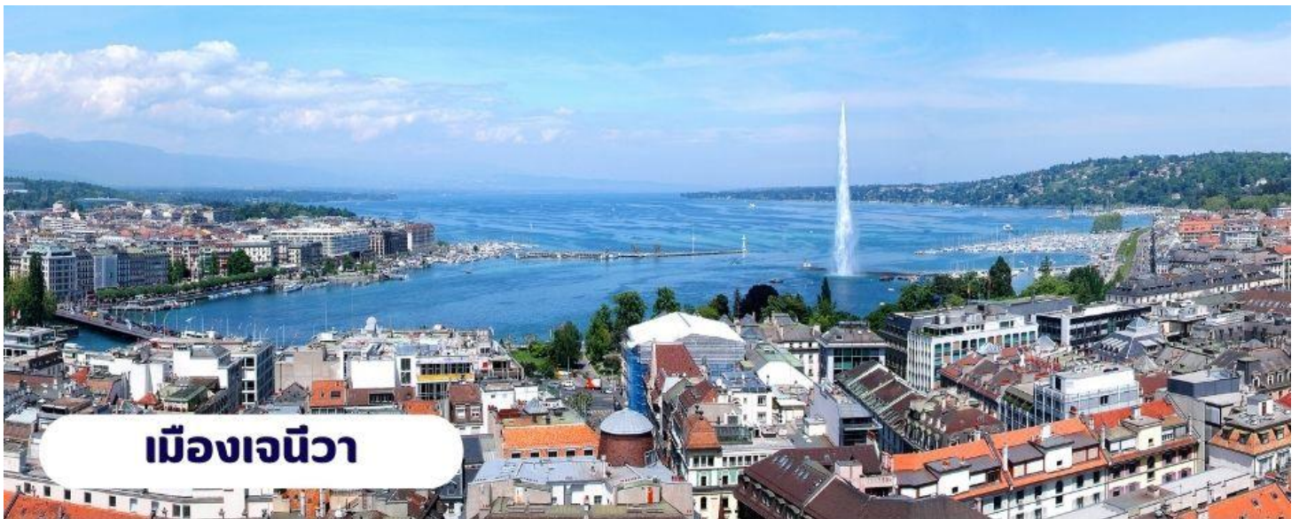
เมืองเจนีวา

๑๐๑ บริการอาหารเช้า ณ ห้องอาหารของโรงแรม นำ ท่านเดินทางสู่ เมืองเจนีวา ใช้เวลาเดินทางประมาณ 4 ชั่วโมง เป็นเมืองขนาดใหญ่ที่มีความงดงาม และ