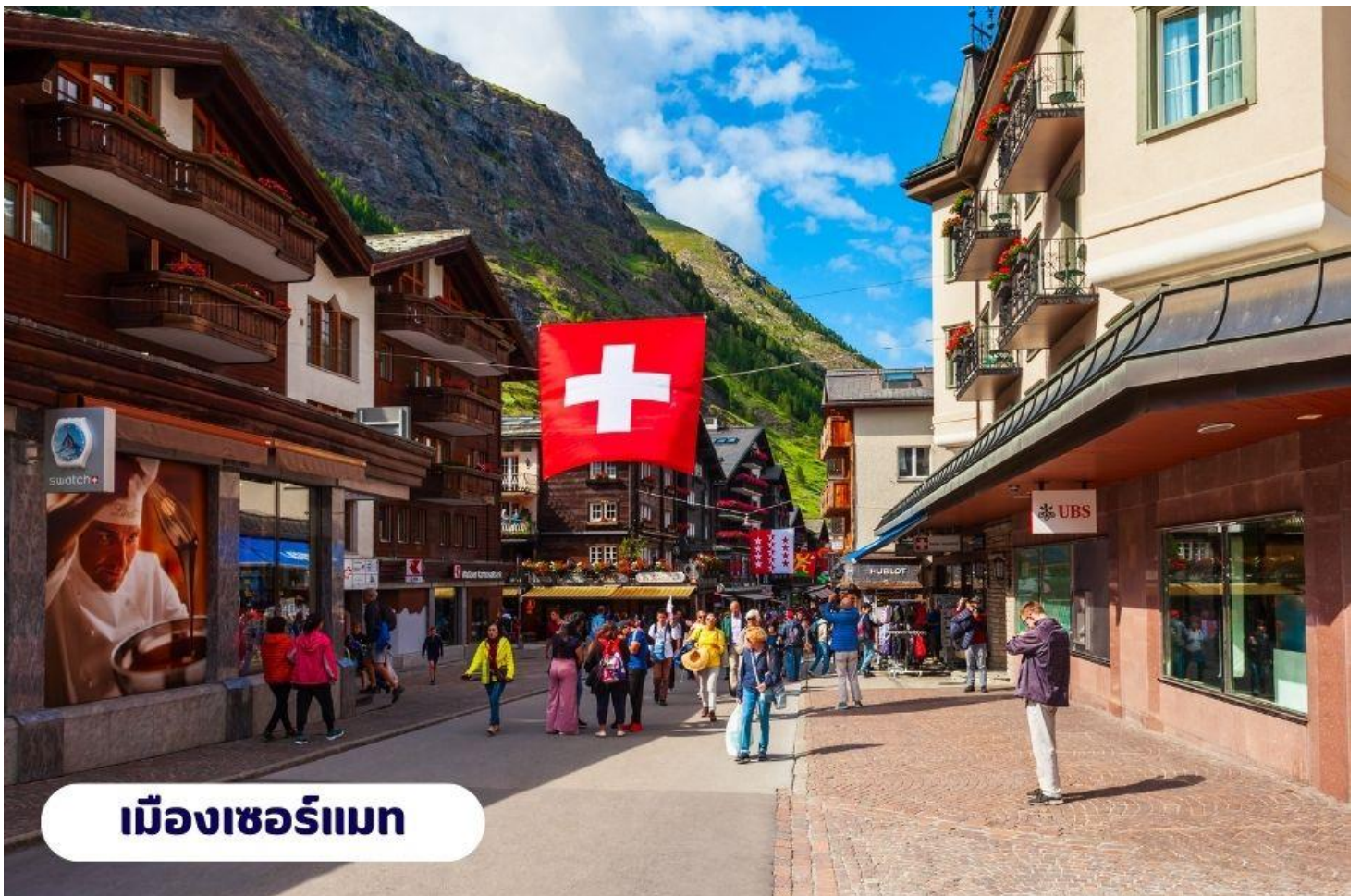
เมืองเซอร์แมท

เที่ยง ๑๑ บริการอาหารกลางวัน ณ ภัตตาคาร จากนั้นนำท่านเดินทางสู่ ยอดเขากอร์เนอร์กรัท (Gornergrat) โดยรถไฟ เส้นทางจะผ่านธรรมชาติทิวทัศน์อันยิ่งใหญ่สวยงามทั้งสองข้างทางสู่ ยอดเขากอร์เนอร์กรัท ที่มีความสูงเหนือระดับน้ำทะเล 3,286 เมตร ที่นี่ท่านจะได้พบจุดที่สวยงามที่สุดของการชมยอด