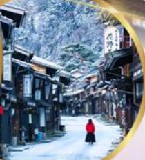
หมู่บ้านโบราณ นาราอิ จุกุ

ราคาเริ่มต้น 39,919 บาท รวมภาษีมูลค่าเพิ่ม 7%