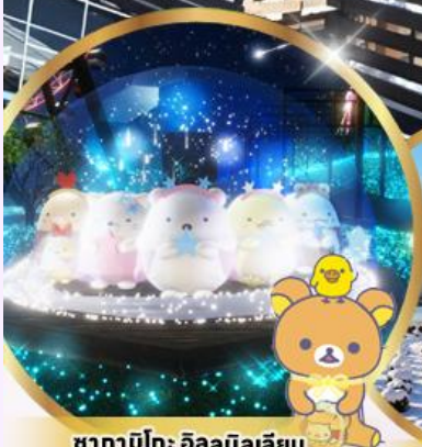
ซากา มิโตะ อิลลูมินาเลี่ยน ธันวาคมสุดท้ายจากค่าย SAN-X สวน ไออิชิ พาร์ค