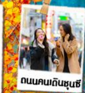
ถนนคนเดินชุนชี่