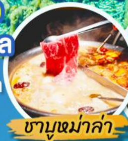
ชาบูหม่าล่า