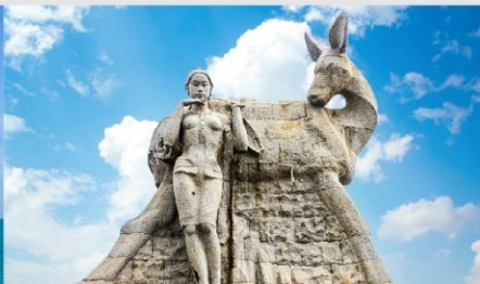
อนุสาวรีย์กวางเหลียวหลิง