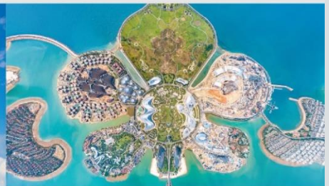
เกาะดอกไม้

*ทางบริษัทฯ ขอสงวนสิทธิ์ในการสลับโปรแกรมทัวร์ตามความเหมาะสมขึ้นอยู่กับสถานการณ์หน้างาน โดยคำนึงถึงผลประโยชน์ของลูกค้าเป็นสำคัญ