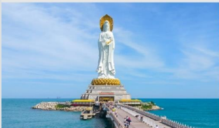
เจ้าแม่กวนอิมหนานชาน