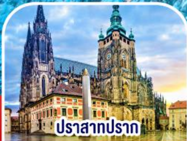
ปราสาทปราก