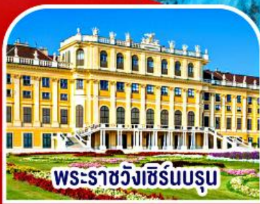
พระราชวังซิรินบรุน