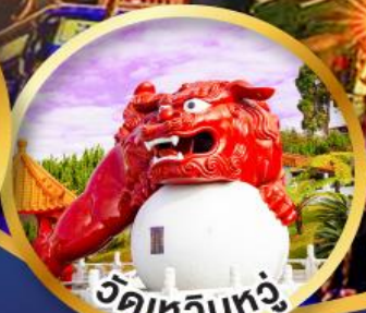
วัดเหวินทง