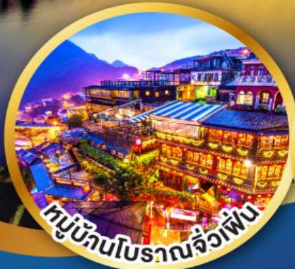
หมู่บ้านโบราณจิวเฟิ่น