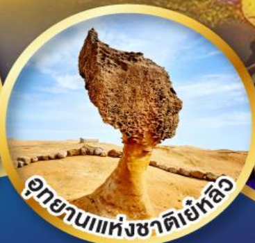
อุทยานแห่งชาติเย่หลิ่ง