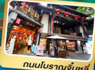
ถนนโบราณจีนหลี