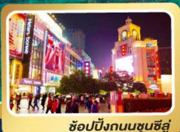
ช้อปปิ้งถนนชุนชิวี่