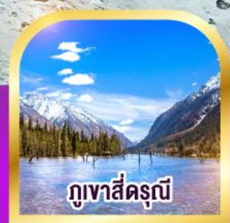
ภูเขาสัตรุณี