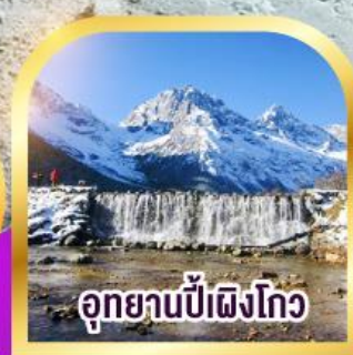
อุทยานป่าเผิงโกว