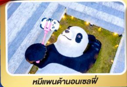
หมีแพนด้าอนเซลฟี