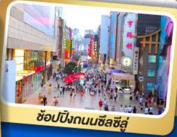
ช้อปปิ้งถนนซิลลี่