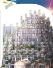
Tian'an 1000 Trees