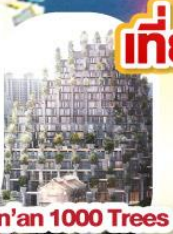
Tian'an 1000 Trees