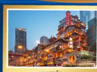
หยงหยาดัง