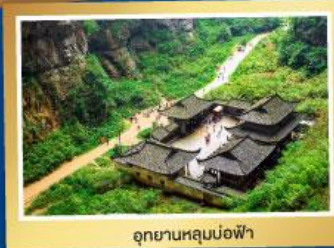
อุทยานหลุมบ่อฟ้า