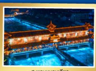
สะพานหนานเฉียว