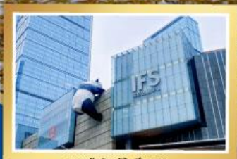
เพนด้ายักษ์ป็นตึก IFS