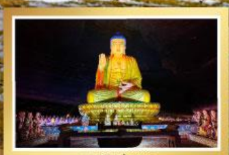
ภูเขาจินฝอซาน