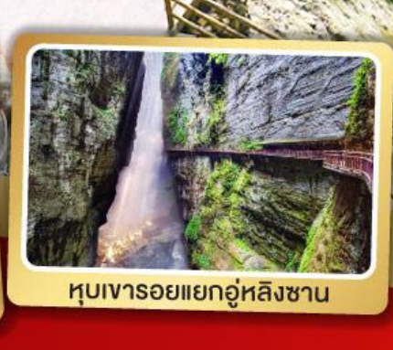
หุบเขารอยแยกอุหลิงซาน