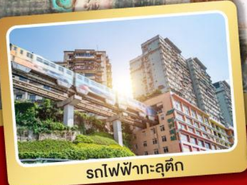
รถไฟฟ้าทะลุตึก