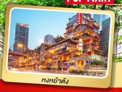
หงหย่าตัง