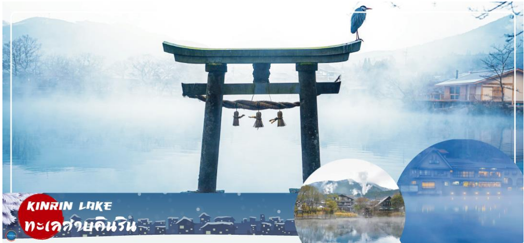
KINRIN LAKE ทะเลสาบคินริน