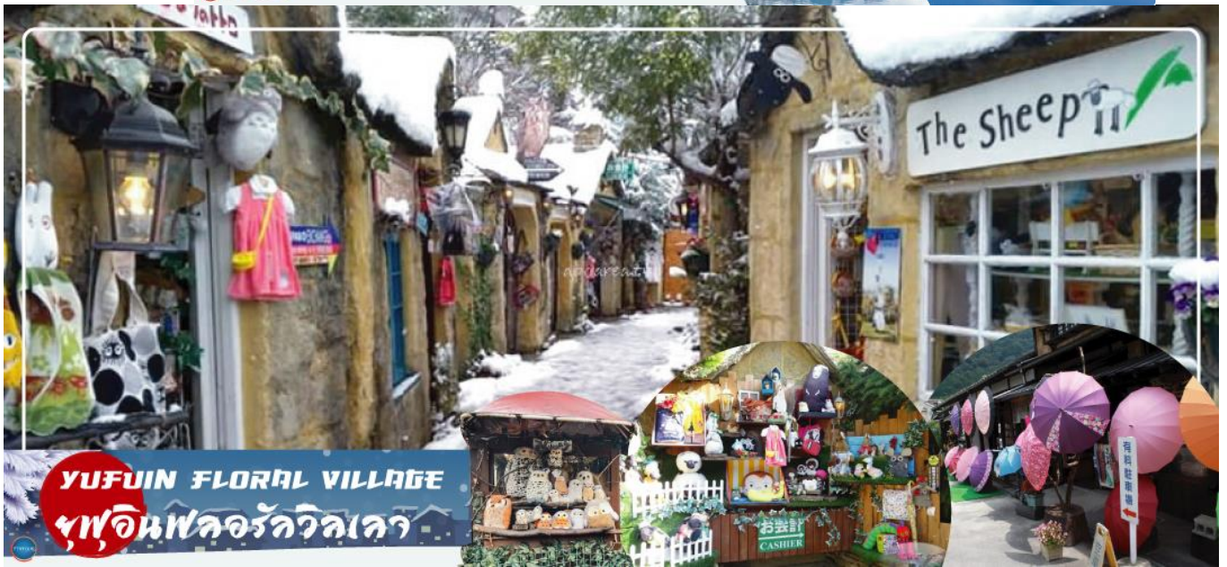
YUFUIN FLORAL VILLAGE หมู่บ้านฟลอรัลวิลเลจ