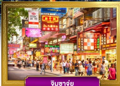
จิมซาจุ่ย