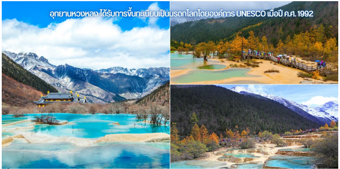
อุทยานหลวง ได้รับการขึ้นทะเบียนเป็นมรดกโลกโดยองค์การ UNESCO เมื่อปี ค.ศ. 1992

จากนั้นนำท่านสู่เมืองตูเจียงเยียน ค่ำ ! รับประทานอาหารค่ำ ณ ภัตตาคาร พักที่ Geling dongfang 4* หรือเทียบเท่า 4ดาว มาตรฐานจีน