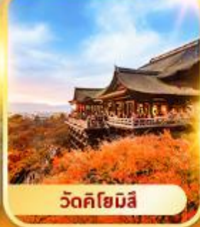
วัดคิโยมิสึ