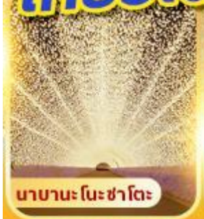
นาคามะ โนะ ซาโตะ