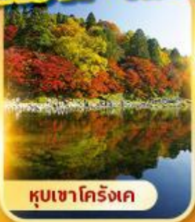
หุบเขาโคริงเค