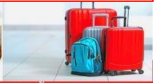
น้ำหนักกระเป๋า สูงสุด 20 กก.

08:40 ถึง สนามบินคันไซ ประเทศญี่ปุ่นดินแดนอาทิตย์อุทัย