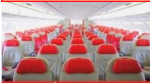
เครื่องบินลำใหญ่ 377 ที่นั่ง

ตัวเครื่องบินเป็นตัวกรู๊ปสำหรับคณะทัวร์ ระบบของสายการบินจะทำการแรนดอมที่นั่ง ซึ่งไม่สามารถล็อกหรือเลือกกระบุนั่งได้ หากลูกค้าต้องการเลือกกระบุนั่ง ทางสายการบินมีบริการอัพเกรดที่นั่ง (ค่าบริการเป็นไปตามที่สายการบินกำหนด)