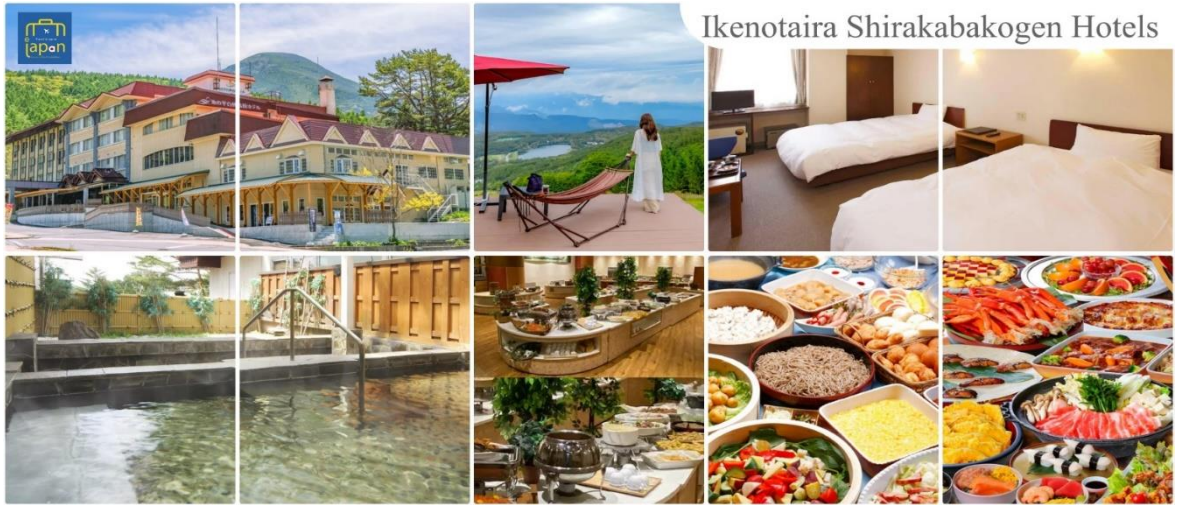
Ikenotaira Shirakabakogen Hotels

หลังอาหารให้ท่านได้ผ่อนคลายกับการแช่น้ำแร่ธรรมชาติ เชื่อว่าถ้าได้แช่น้ำแร่แล้ว จะทำให้ผิวพรรณสวยงามและช่วยให้ระบบหมุนเวียนโลหิตดีขึ้น