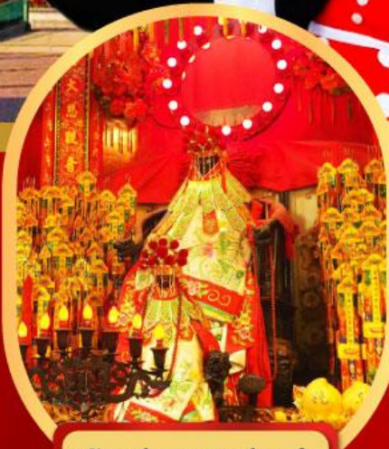
เจ้าแม่กวนอิมฮ่องกง