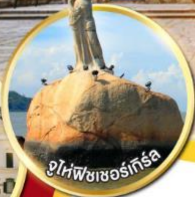
จูไห่พีชเชอร์ทรี