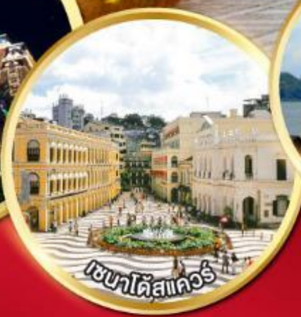
เวเนโตสแควร์