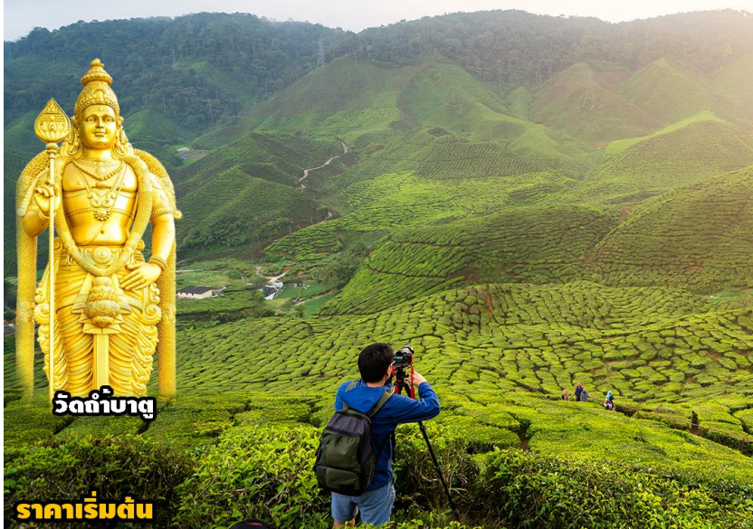
วัดถ้ำบาตู

ปุตราจายา-คาเมอร์รอน-เก็นติ้ง-กัวลาลัม 3วัน2 คืน โดยสายการบิน มาเลเซีย แอร์ไลน์ (MH)