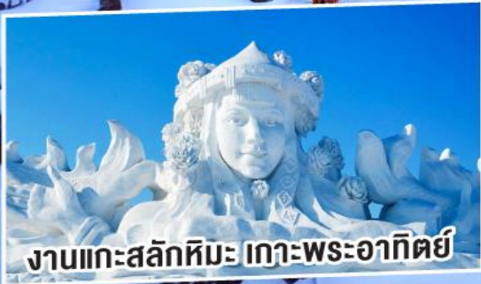
งานแกะสลักหิมะ เก้าพระอาทิตย์