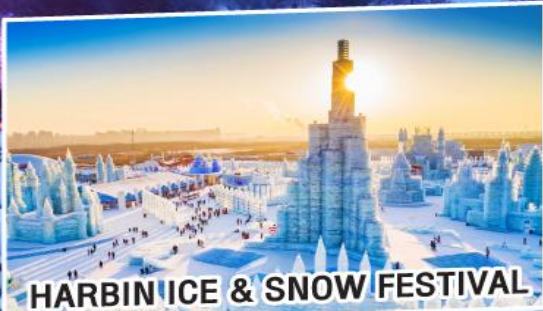
HARBIN ICE & SNOW FESTIVAL