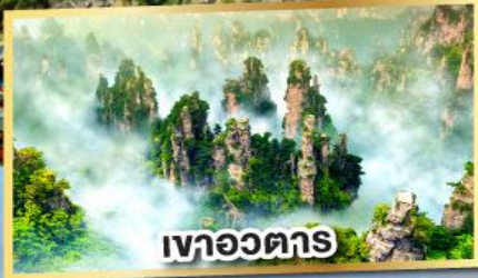
เจาอวตาร