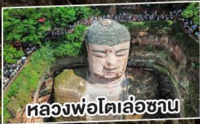
หลองพ่อโตเล่อซาน