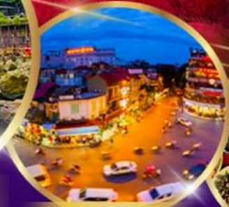
ถนน 36 สาย