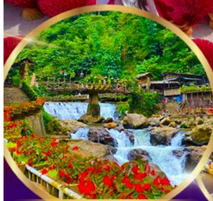
หมู่บ้านชาวเขา ก๊ต ก๊ต