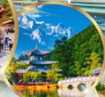
สระมิ่งกรดำ