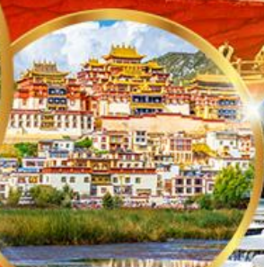
วัดชงจ้านหลิน