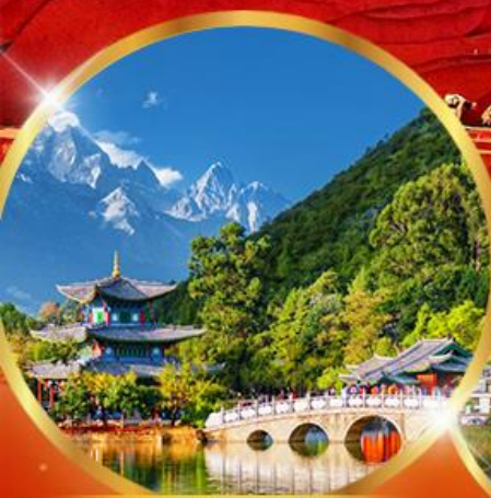
สระมิงกรดำ