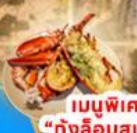
เมนูพิเศษ! "กุ้งล็อบสเตอร์"