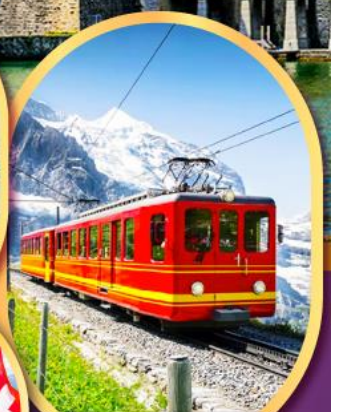
รถไฟผู้ ยอดเขาจุงเฟรา