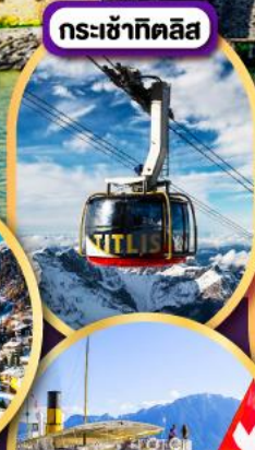
กระเช้ากิตติส