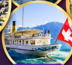
ล่องเรือ ทะเลสาบเจนีวา