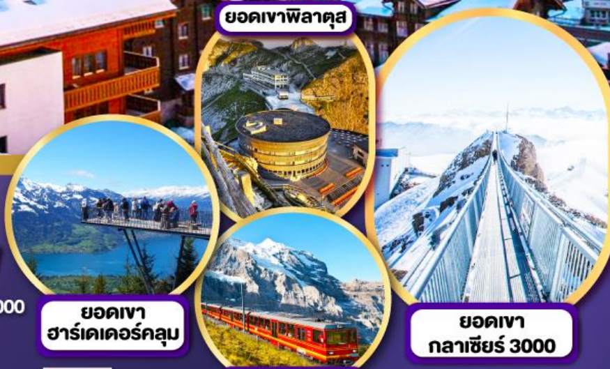
ยอดเขาพิลาคุส