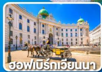
ฮอฟบวร์กเวียนนา