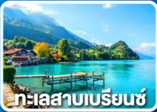
ทะเลสาบเบริยน์ซ์