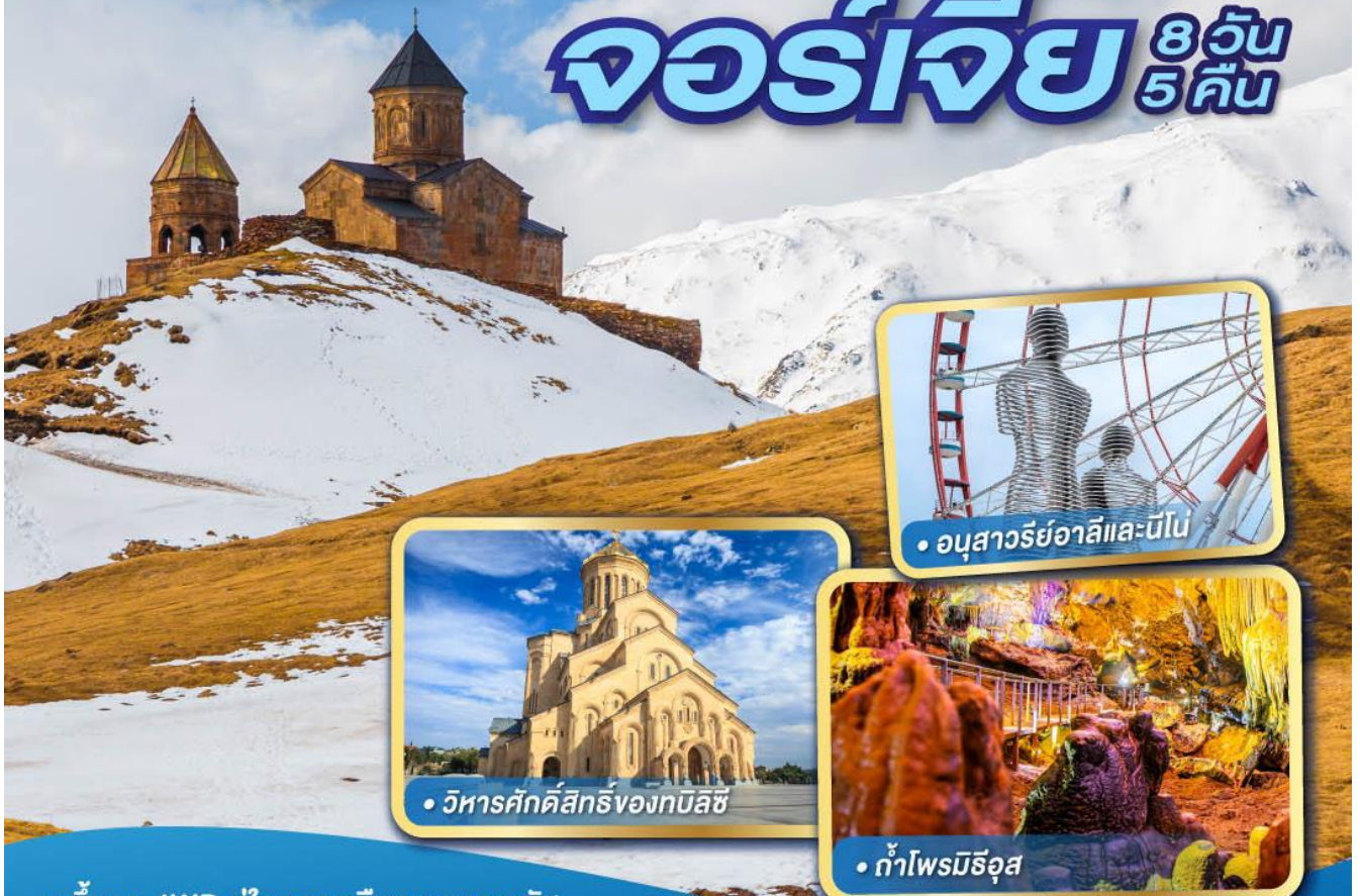
• อนุสาวรีย์อาลีและนีโน